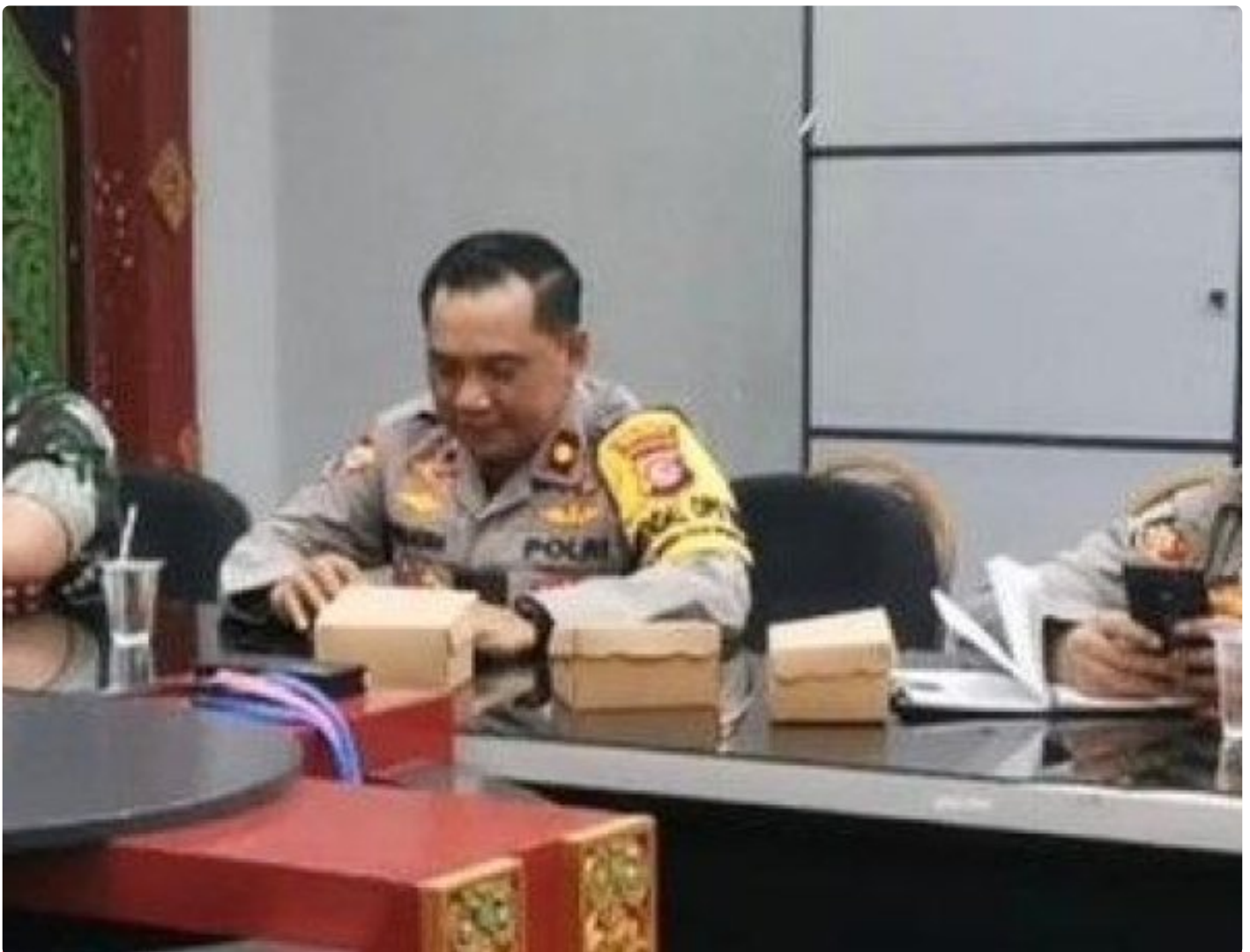
Kabagops Polresta Mataram saat menghadiri Rakor di Kantor Bupati Lombok Barat, Selasa (10/12/2024)